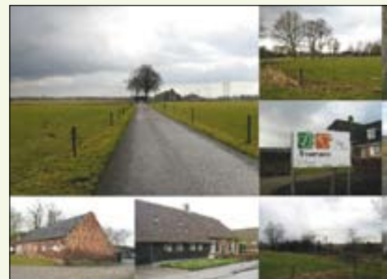
Door het ontwerpteam als positief ervaren beelden in het gebied