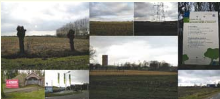
De als negatief ervaren beelden

De beschrijving van de serie workshops geeft een indruk van het ontstaan van het inrichtingsvoorstel en de soms conflicterende belangen die daarbij speelden. Aan