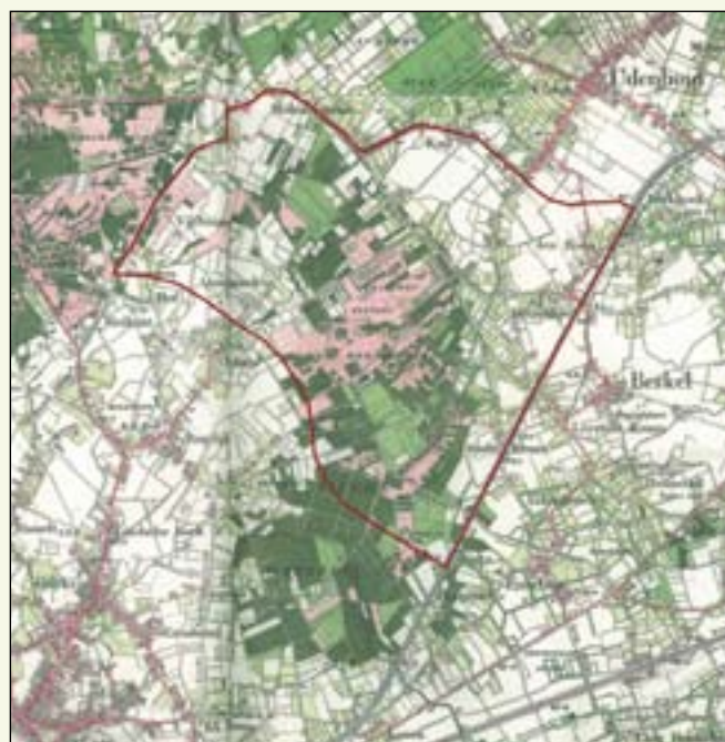
Het plangebied op de kaart van 1900