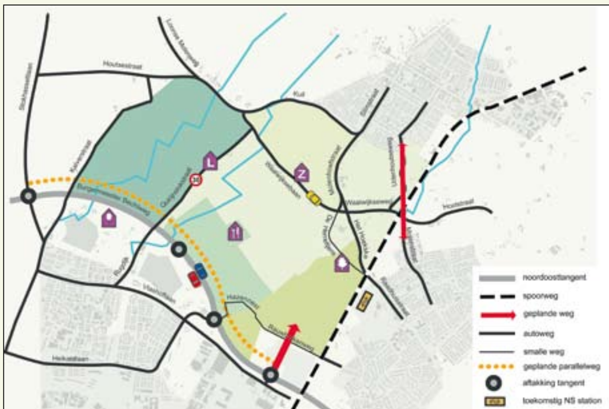
Autoverkeer in het inrichtingsvoorstel