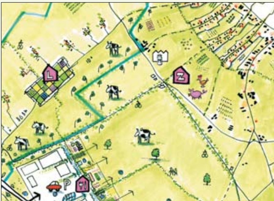
Het inrichtingsvoorstel: het centrale landschap

Binnen dit inrichtingsvoorstel passen diverse invullingen van het centrale landschap.