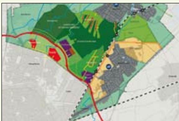
De structuurvisie Noordoost 2020 (gemeente Tilburg)

In de Structuurvisie Noordoost 2020 kreeg het gehele gebied tussen Tilburg Noord, Udenhout en Berkel-Enschot de naam 'Landgoed de Nieuwe Warande'. De visie stelt dat het middengebied (het centrale landschap) open moet blijven en dat aan de randen (de noord-, oost-, zuid- en west-kamer) beperkt gebouwd mag worden (landelijk wonen). De gemeente Tilburg heeft de Structuurvisie in 2009 vastgesteld.