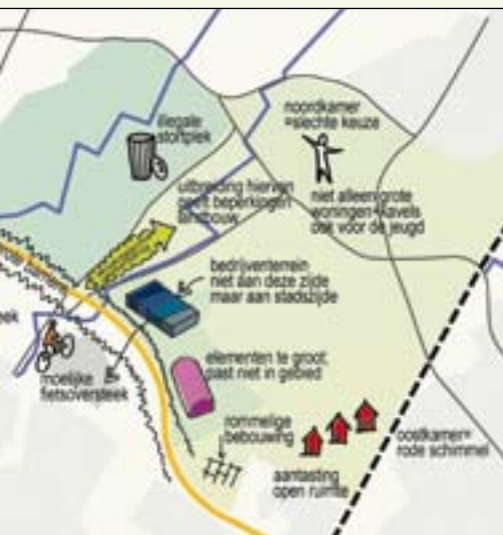
aspecten op de kaart

het slot van het proces zijn de verschillende partijen enthousiast over het inrichtingsvoorstel dat ze samen ontwierpen.