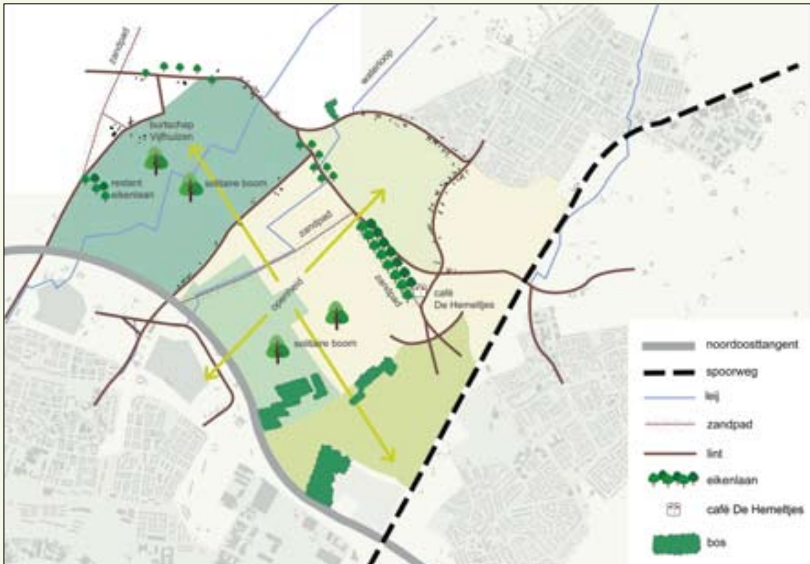
Waardevolle landschappelijke kenmerken en cultuurhistorische waarden

kende driehoeken van kruisende linten, ligt van oudsher Café De Hemeltjes. In het westen van het gebied, aan de Stokhasseltlaan, ligt de buurtschap Vijfhuizen, een typische, kleine clustering van (boeren)bebouwing en oude bomen in het open land.