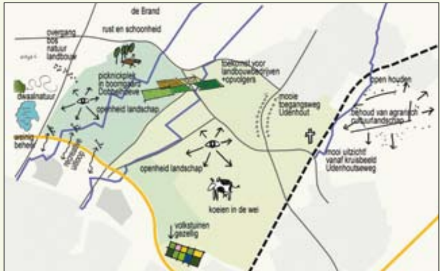
De positieve aspecten op de kaart

Het inrichtingsvoorstel is een idee en uitdrukkelijk geen blauwdruk voor de invulling van het gebied. De integrale tekening van het inrichtingsvoorstel is bedoeld als een inspirerend, illustratief wensbeeld. Integraal, omdat de verschillende betrokkenen bij het gebied het voorstel dragen. In d'n landbouwhof van