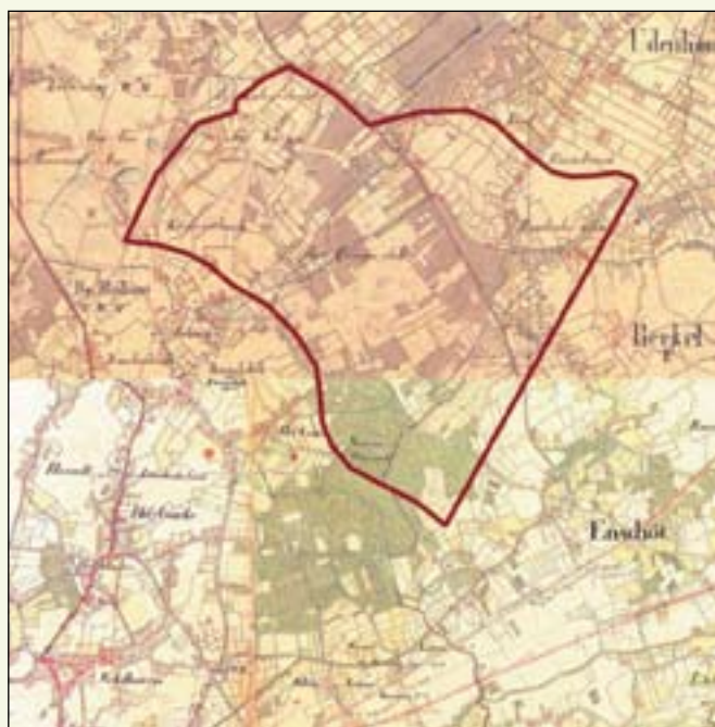
Het plangebied op de kaart van 1850

Het bosgebied dat de Nieuwe Warande rond 1900 nog was, bestaat nu nog maar voor een klein deel ten noorden van Loven. Door de eeuwen heen is het bos en het ruige land eromheen meer en meer ontgonnen en omgevormd tot landbouwgebied. De vergaande verstedelijking in de twintigste eeuw leidde tot een open landschappelijk gebied tussen de infrastructuur en verstedelijkte kernen van Tilburg Noord, Udenhout en Berkel-Enschoot. Veel structuurlijnen op de oude kaarten bestaan nog steeds. Ze vormen de logische lijnen vanuit