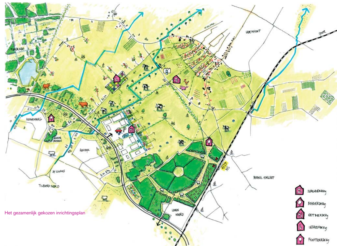
Het gezamenlijk gekozen inrichtingsplan

Het ontwerp Architectenbureau Attika uit Amsterdam ontwierp verschillende scenario's. Een ontwerpteam gaf hier in vijf bijeenkomsten invulling aan. De enquête-uitslag en ervaringen van