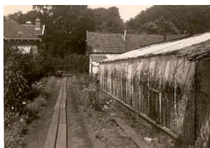
Zo was het...