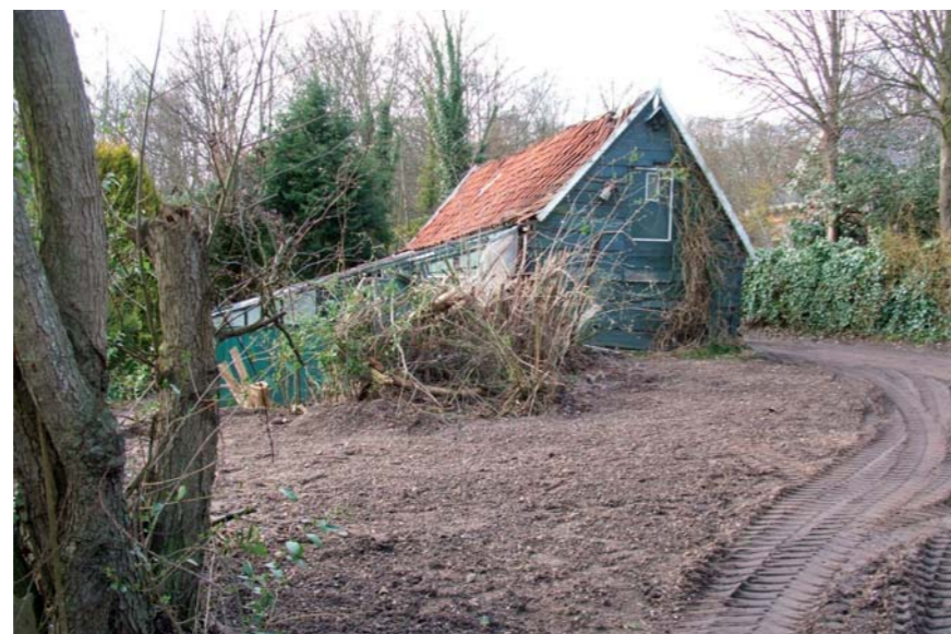
Zo is het ...